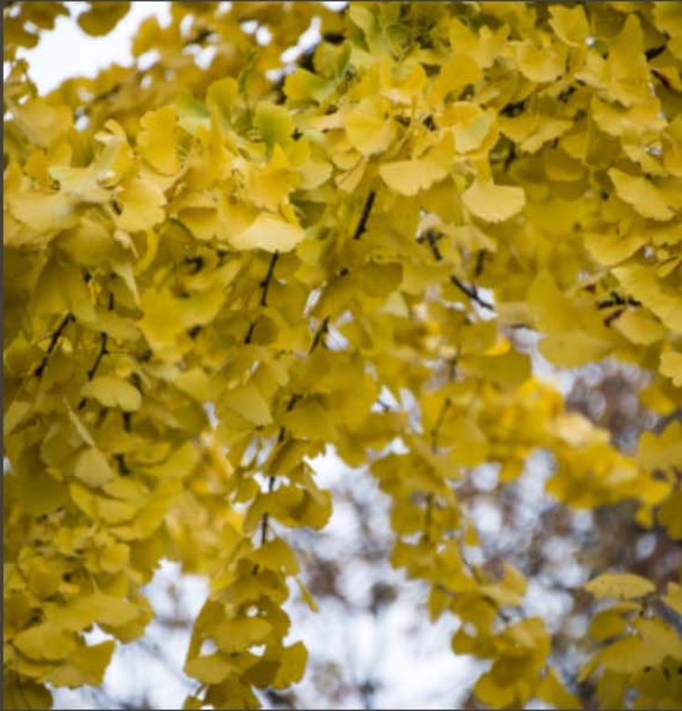
Voici l'habitat d'un des sorciers.