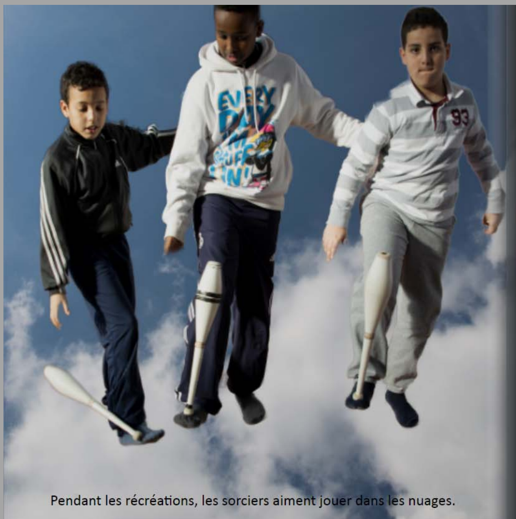
Pendant les récréations, les sorciers aiment jouer dans les nuages.